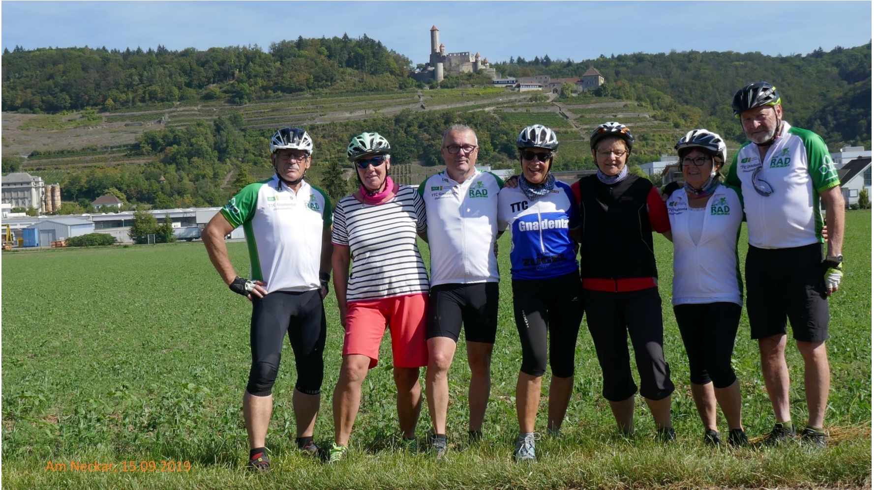
Am Neckar, 15.09.2019