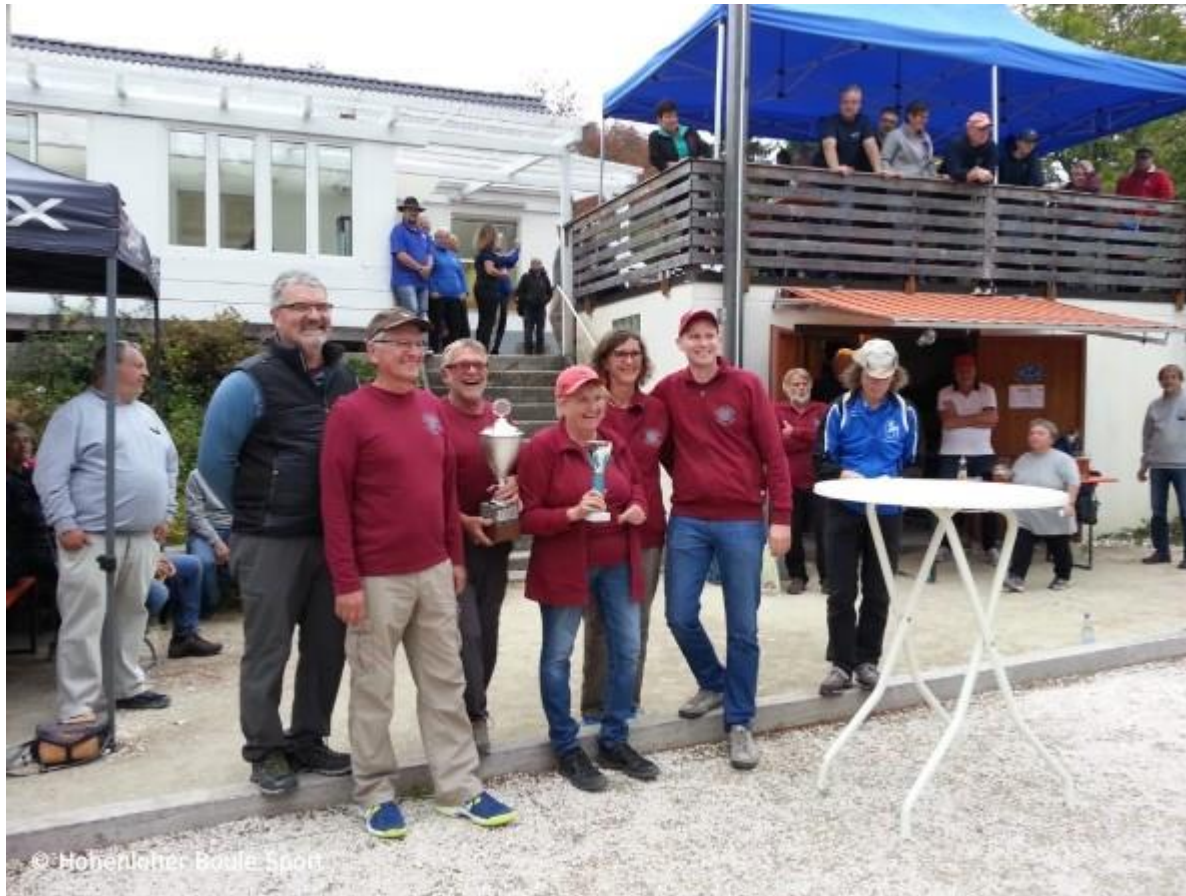
Bild 1: 29.09.2019 Boule Team Hohenlohe