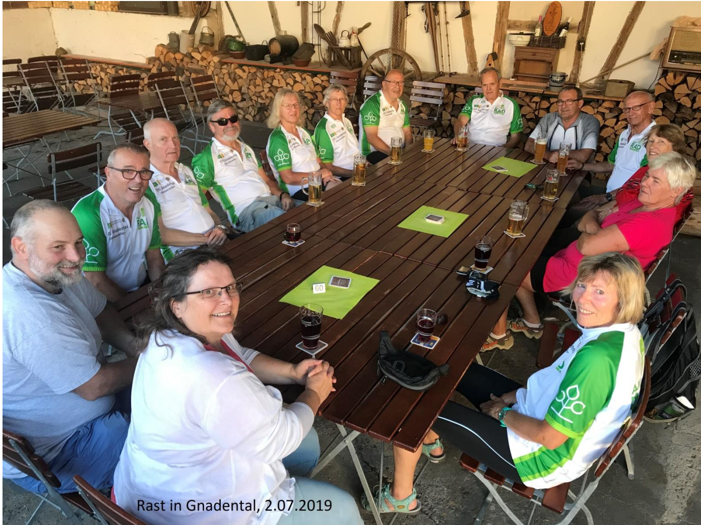
Rast in Gnadental, 2.07.2019