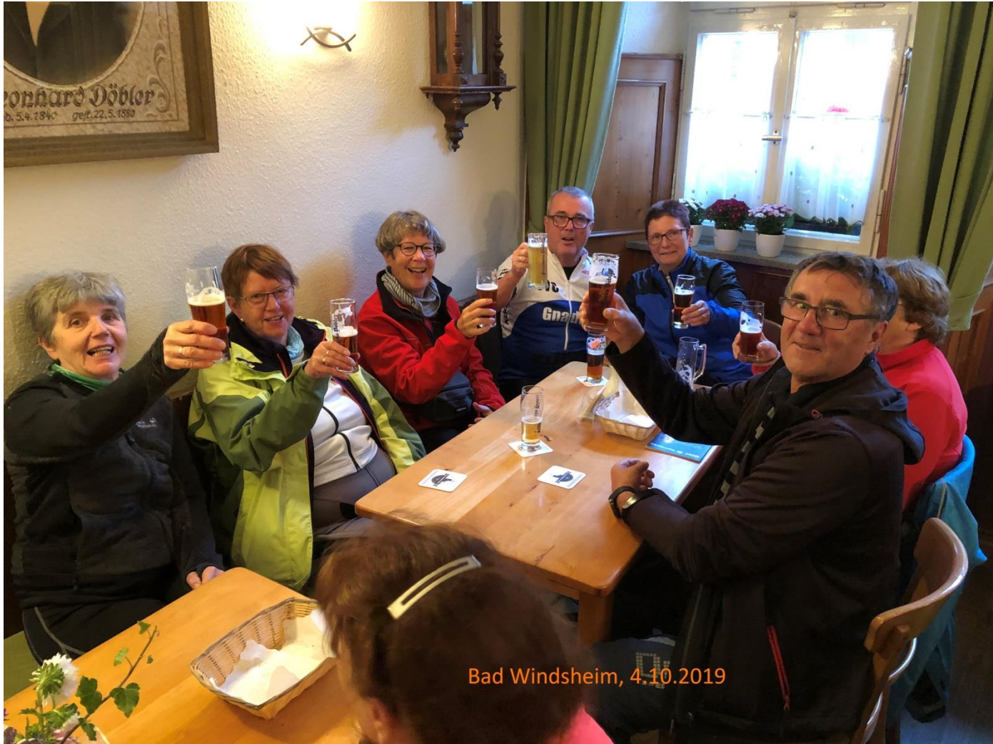
Bad Windsheim, 4.10.2019